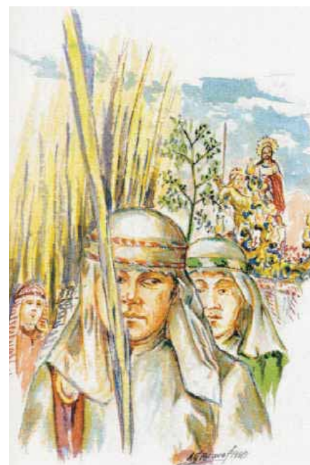
Dibujo Ángel J. García Bravo