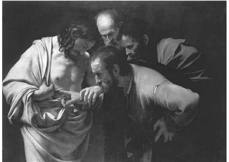
Incredulidad de Santo Tomás , Caravaggio.

«Luego dijo a Tomás: “Trae acá tu dedo, mira mis manos, alarga tu mano y métela en mi costado, y no seas incrédulo sino creyente”» Jn 20, 27