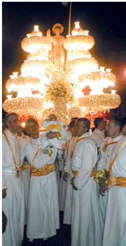
San Juan Californio

Siempre hemos dicho, porque es verdad, que las procesiones de Cartagena se caracterizan por tres