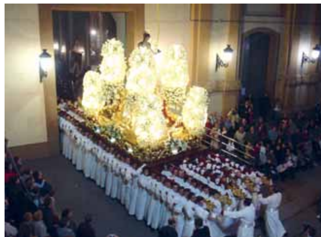
San Juan Marrajo