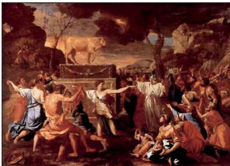
La Adoración del Becerro de Oro. (1633-34), Nicolas Poussin - Éxodo 32, 1-35

¡Muchos falsos profetas se levantarán, y engañarán a muchos! (Mateo 24:11; Marcos 13:22)