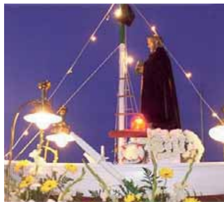
San Pedro, Cabo de Palos

No me gustaría acabar este pequeño artículo sin hacer referencia al