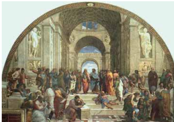
La Escuela de Atenas Fresco realizado por Rafael entre 1509-1510

Pero no sólo existen enfrentamientos entre agrupaciones de una misma cofradía sino que las dos grandes cofradías, como en política, se acusan en ocasiones de ser las verdaderas defensoras del espíritu de la Semana Santa. De ser las