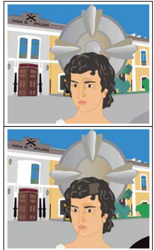
Ilustraciones de Paco Manzano