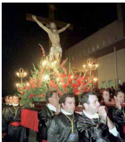
Semana Santa, Cabo de Palos

En Cartagena, nos pasamos la vida quejándonos del Centralismo de la Capital en todos los ámbitos, económico, político, cultural, etc. La famosa frase “se lo llevarán a Murcia” recorre nuestras calles en cualquier tertulia entre amigos o reunión social. Incluso desconfiábamos de adelantarnos a Murcia en la concesión de la Internacionalidad de nuestra Semana Santa, y ahí la tenemos.